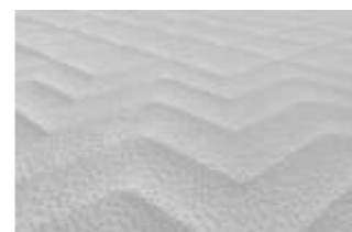
Doppeltuch Silver Active-SSW Bestellindex (3.0060SSW)

Entwickelt mit einer speziellen Technologie, um Feuchtigkeit abzuleiten hilft Ihnen der Coolmax® Matratzenbezug trocken und energiegeladener zu bleiben. Coolmax® ist ein Hochleistungsgewebe, das im Vergleich zu anderen Matratzenbezügen schnell trocknet und die Körperfeuchtigkeit ausgleicht. Durch diesen Vorteil minimiert Coolmax® das Schwitzen und sorgt so für einen gesunden Schlaf. Wie es funktioniert? Der Coolmax® Matratzenbezug absorbiert die Feuchtigkeit und verteilt sie über den Stoff, damit sie schnell verdunstet. Es entsteht ein Effekt wie beim Berühren von kühlem Metall. Coolmax® Gewebe ist waschbar bis 60°C.