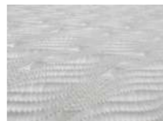
Doppeltuch 1.0285 Bestellindex (1.0285)