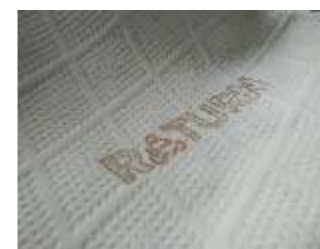
Doppeltuch ReTURN (RET)

Unser Standardstoff für Topper und Basisausstattung für unsere Boxspringsysteme Doppeltuch 1.0285 besteht aus 97,8 % Polyester (PES) und 2,2 % (Lykra). Mit 420 g/m 2 ist es ein schweres Doppeltuch, Versteppung nicht nötig. Dadurch erleichtert sich die Handhabung beim Waschen. Die Eigenschaften des Polster- und Topperschaumstoffs der Matratze werden besser übertragen als bei verstepten Drellen, was gerade bei modernen Gel- und Viskoschäumen vorteilhaft ist. 1.0285 ist bis 60°C waschbar und eignet sich gut für Matratzentopper und Standardmatratzen.