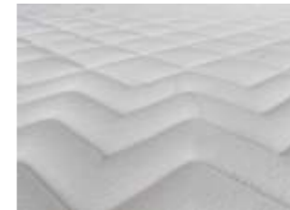
Doppeltuch Aloe Vera Bestellindex (AV)