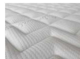
Doppeltuch Silver Active Bestellindex (SA)

Doppeltuch aus 35% Baumwolle und 65% Polyester, ausgerüstet mit dem natürlichen Extrakt der Aloe Vera Blätter. In der Stofffaser wird Aloe Vera in mikroskopisch kleinen Wachskügelchen eingelagert und durch Reibung über die Zeit abgegeben. Dieser hautfreundliche Effekt ist auch nach vielen Wäschen noch wirksam. Der Bezug ist mit 350 g/m 2 atmungsaktiver Klimafaser verstept und bietet angenehmen Schlafkomfort. Bei der Wäsche mit bis zu 60°C werden Hausstaubmilben abgetötet. Der Bezug ist für Allergiker geeignet.